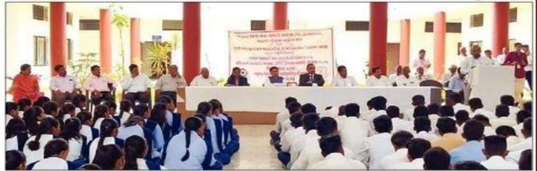
भानसहिवरा : येथील सुलोचना बेलहेकर शिक्षण संस्थेत कायदेविषयक जनजागृती कार्यक्रम पार पडला.